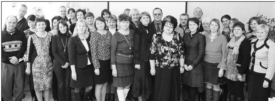
Skolu padomju dalībnieki jau piekto reizi tiekas kopā, un vienmēr ir arī kopilde.

Šī gada 19. februārī Dravnieku pamatskolā tikās novada skolu padomju pārstāvji no Riebiņu novada izglītības iestādēm.