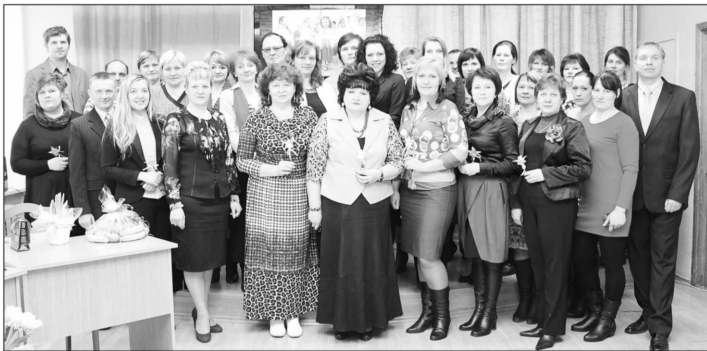
Novada izglītības iestāžu padomju dalībnieku kopbilde Riebiņu vidusskolā.

Pēc šīm aktivitātēm skolēnu parlaments savukārt aicināja viesus būt klāt latviešu valodas (skolotāja Irēna Ormane), angļu valodas (skolotājas Natālija Smukša un