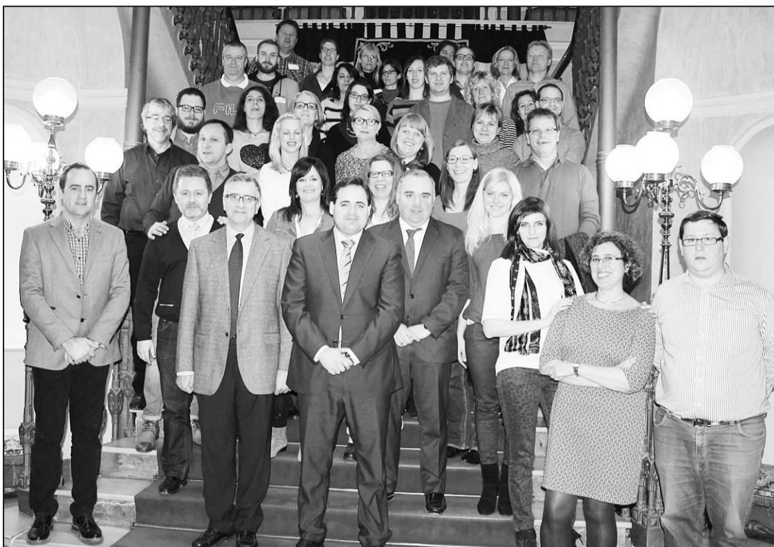
Starptautiskās jaunatnes projekta konferences dalībnieku kopbilde administrācijas ēkā Albasete provincē Spānijā.

Tā kā Spānijā bez darba lielākoties ir jaunieši ar augstāko izglītību, jo darba devēji uzskata, ka šiem jauniešiem ir gan augstākas prasības pret darba devēju, gan arī atalgojumam ir jābūt samērīgam, tad gan no vietējās pašvaldības, gan no Spānijas Nodarbinātības un sociālās drošības ministrijas puses ir izstrādātas vairākas programmas, kam tuvakajā nākotnē ir jāveicina jaunu uzņēmēju izglītošanu un atbalstīšanu Spānijā. Tā tuvakajiem gadiem tika piešķirti 3,485 miljardi eiro jauniešu darbinātības programmas ieviešanai un uz-