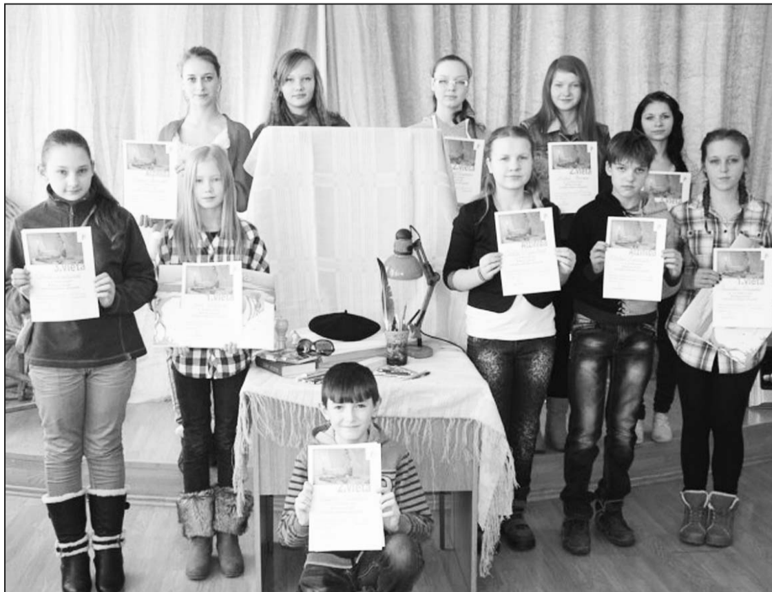
Labākie Riebiņu novada vizuālās mākslas olimpiādes dalībnieki.