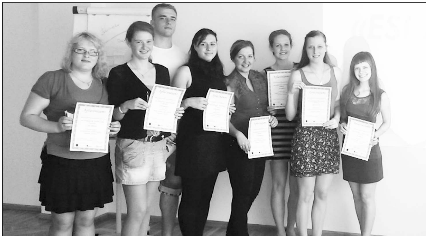
Saņemot apliecinājumu par piedalīšanos informatīvajā seminārā „Esi aktīvs”, Riebiņu jaunieši izrādīja vēlmi iesaistīties arī plānotā jauniešu iniciatīvu centra "Pakāpieni" darbībā.

Papildus tika sniegts ieskats par jauno programmu Erasmus+ un starptautisko