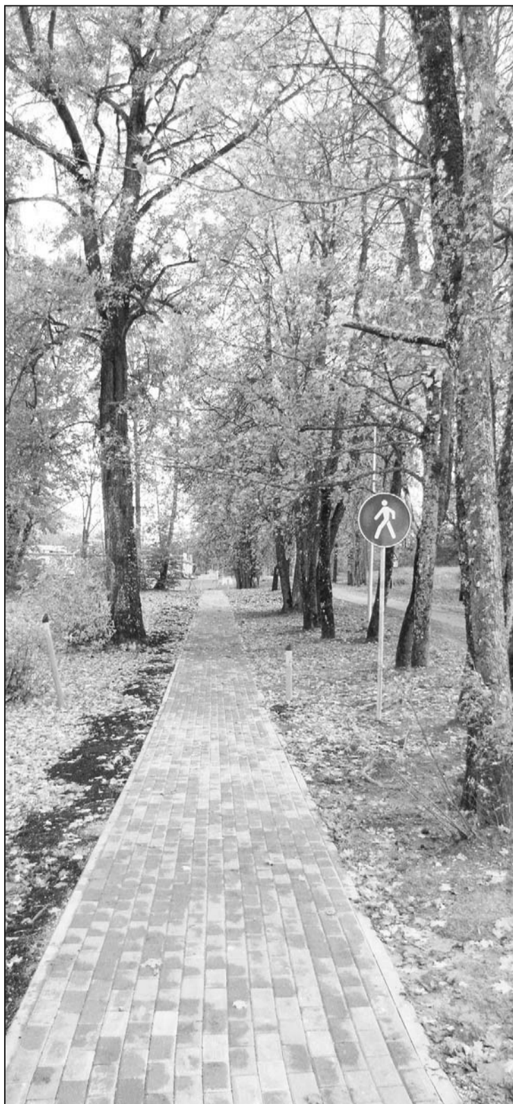
Aizvadītā gada rudenī tika pabeigta gājēju ietves izbūve Kastīrē, Rušonas pagastā.

Projekta "Gājēju ietves izbūve, apgaismojuma ierīkošana, satiksmes organizācijas ceļa zīmju uzstādīšana Liepu ielā (Kastīrē), Rušonas pagastā" kopējās izmaksas sasniedza 58 701,65 latus (ar PVN). Attiecināmās izmaksas – 48 116,11 lati, no kuriem publiskais finansējums (90%) ir 43 304,50 lati un pašvaldības līdzfinansējums (10%) 4811,61 lats. Šī projekta ietvaros pašvaldība sedz PNV izmaksas un autoceļa rekonstrukcijas darbu uzraudzības izmaksas. Rekonstrukcijas darbus saskaņā ar iepir-