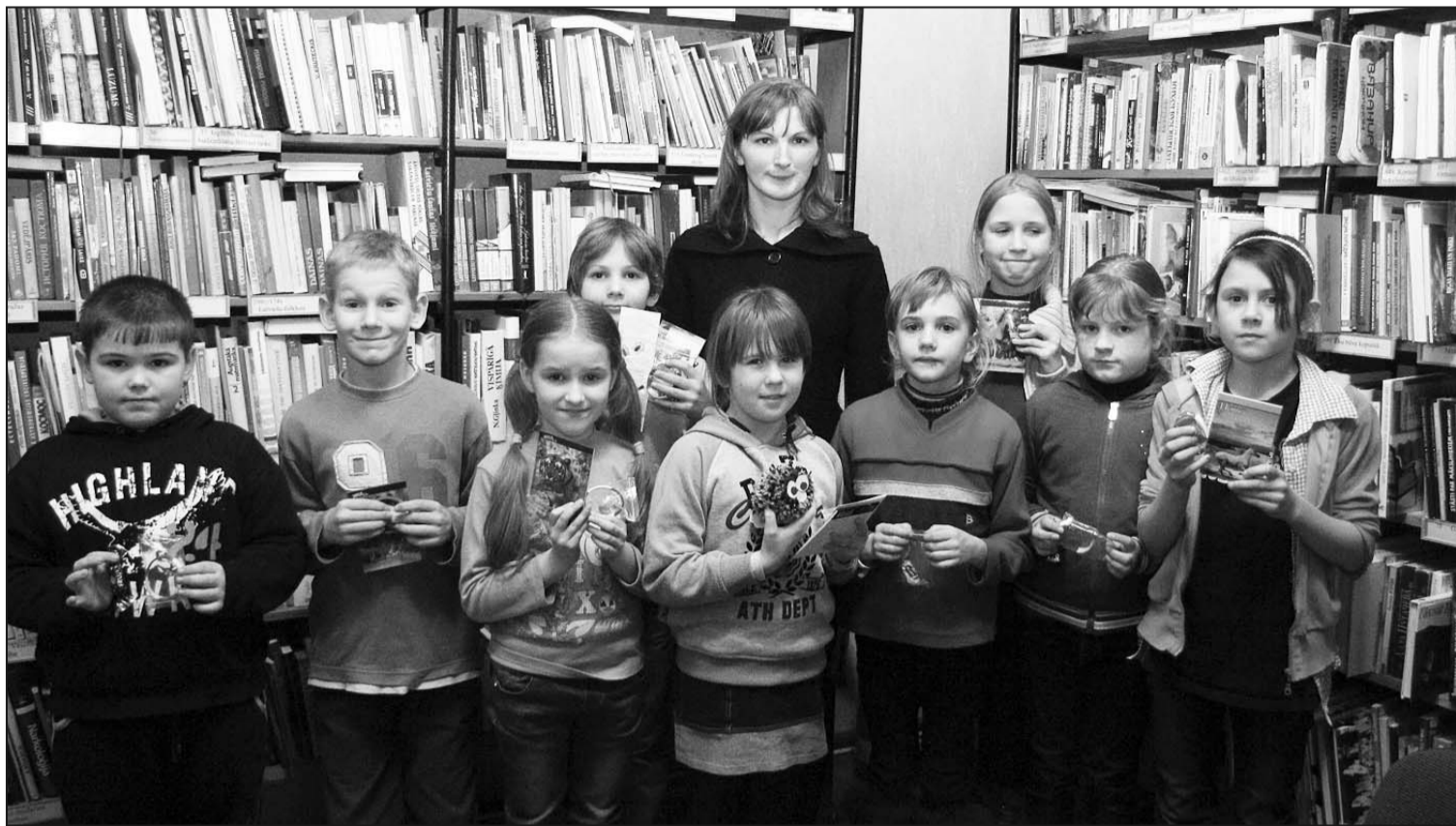
Jaunākās grupas čaklāko lasītāju kopilde.

Visiem pasākuma dalībniekiem bija iespēja iesaistīties dažādās interesantās aktivitātēs: minēt krustvārdu miklas, atšifrēt grāmatu varoņus, uzrakstīt moderno latviešu tautas pasaku, uzziņēt pašiem savas grāmatzīmes, atpazīt grāmatu fragmentus, uzrakstīt grāmatu nosaukumus, kur bija doti tikai pēdējie burti, un sacerēt stāstiņu, iekļaujot Jauniešu žūrijas grāmatu nosaukumus.