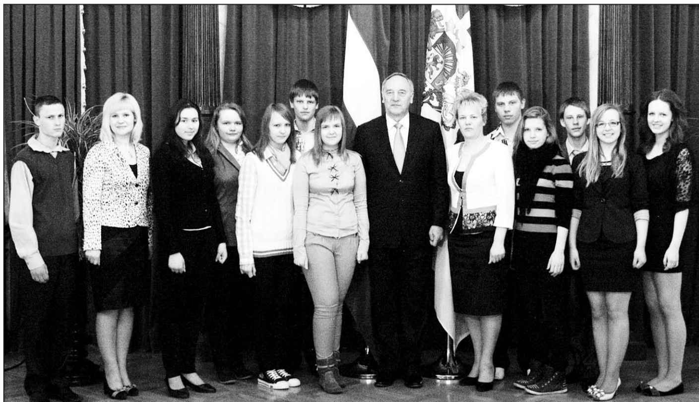
Riebiņu vidusskolas 9. a klase, audzinātāja un skolas direktore viesos pie valsts prezidenta Andra Bērziņa.

Pēc svinīgā pasākuma jaunieši tuvāk iepazīnās neformālā atmosfērā pie bowlinga celiņiem, bet pēc tam devās uz Latvijas Banku, lai iepazītos ar atjaunotā lata jubilejas izstādi “Ls – 20. Nacionālās valūtas mākslas gadi”.