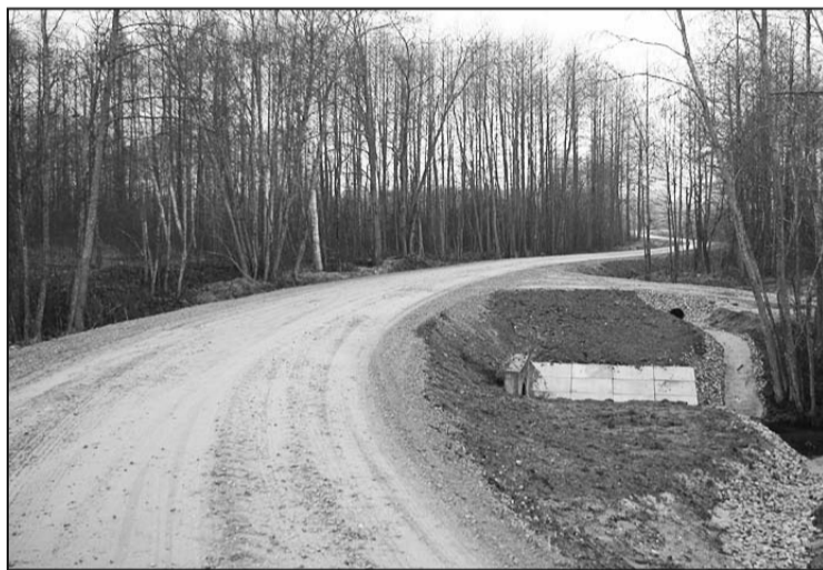
Rekonstruētais ceļš Soboļevka – Priževoti Galēnu pagastā.

2001. gada 3. decembrī Riebiņu novada Galēnu pagasta B