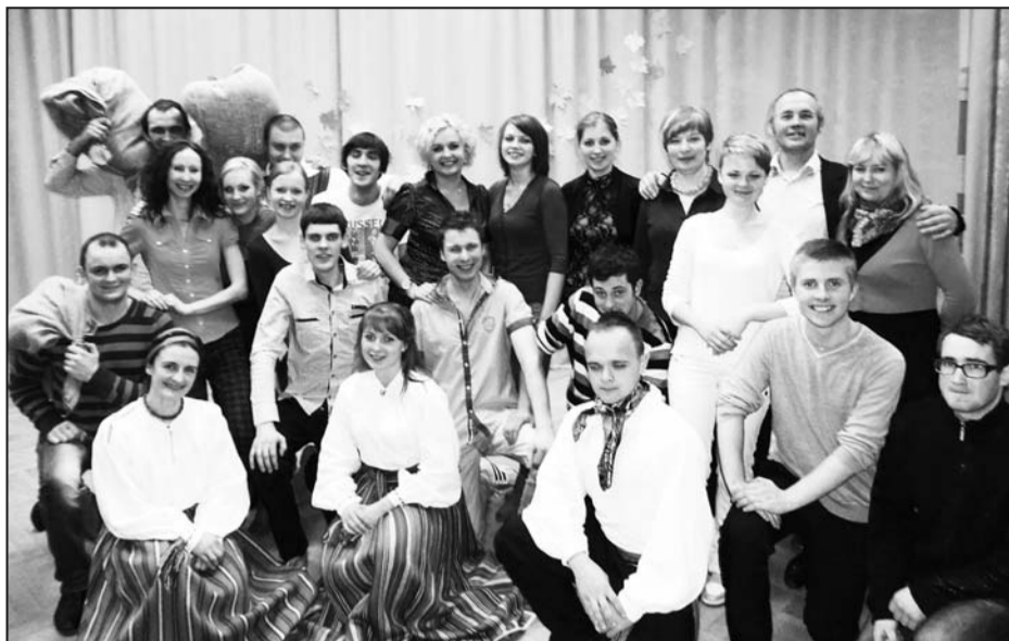
Labdarības koncerta "Dāvā iespēju lasīt!" dalībnieku kopbilde.

Bibliotēka, tūlīt pēc skolas, ir otra Gaismas pils laukos, kur ikvienam, tur ienākot, ir iespēja kļūt vēl ziņošākam, redzīgākam, dzirdīgākam un jūtīgākam, ielūkojoties grāmatās, preses izdevumos un internetā pieejamās informācijas labirintos. Pašsaprotama lieta, ka, ienākot bibliotēkā, jaunāko ziņu izklāsts, spilgtāko notikumu kaleidoskops un viss par aktuālākajām tendencēm mūsdienu sabiedrības attīstībā, bibliotēkas lietotājam ir pieejams jaunākajos preses izdevumos: žurnālos un laikrakstos, kurus, spiedīgu finansiālo apstākļu dēļ, Stabulnieku bibliotēka nevarēja atļauties abonēt jau trešo gadu pēc kārtas, izņemot Preiļu reģiona laikrakstu "Novadnieks".