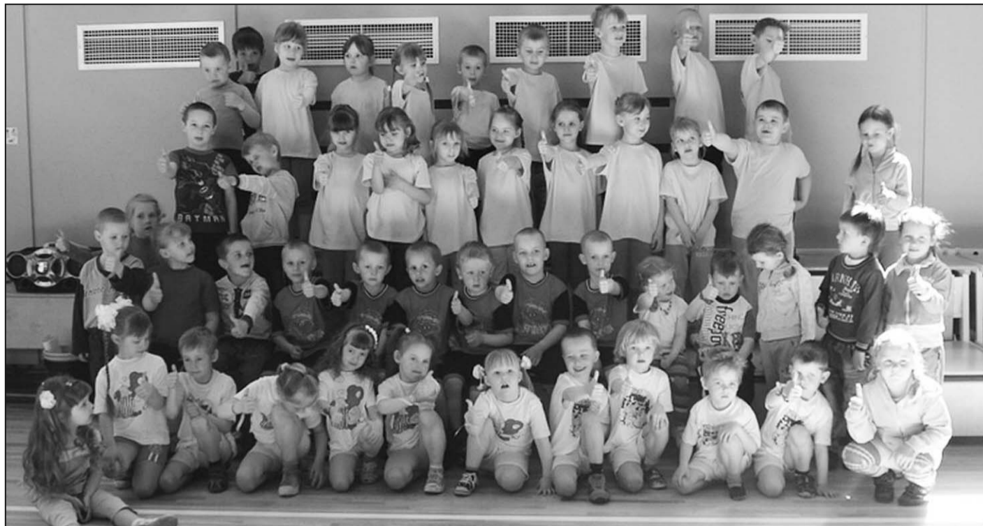
Rezultāts sasniegts – novada mazākie sportisti ir priecīgi un apmierināti!

3. maija rīts Galēnu sporta hallē pulcēja kuplu pirmsskolnieku skaitu no Rušonas, Riebiņiem, Silajāņiem, Dravniekiem, Ga-