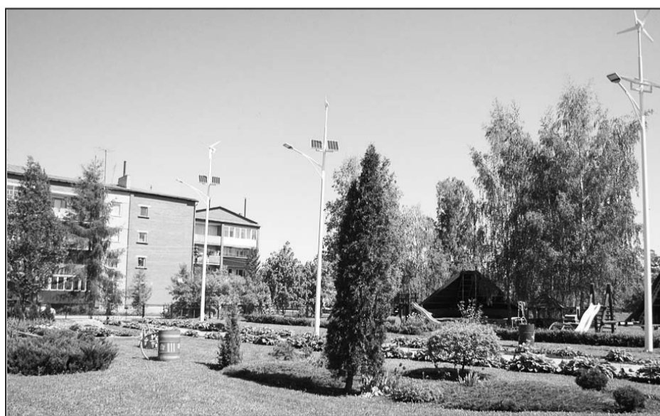
Hibrīdaternas pie Riebiņu pirmsskolas izglītības iestādes „Sprīditis”.

ta "Atjaunojamo energoresursu pielāgošanas iespējas Latgales reģionā, Utenas apriņķī un Panevėžys apriņķī" finansējums ir EUR 96 309,00, no kura 81 862,65 eiro ir līdzfinansējums no ERAF, 9630,90 eiro Riebiņu novada domes līdzfinansējums, 4815,45 eiro Valsts budžeta finansējums.