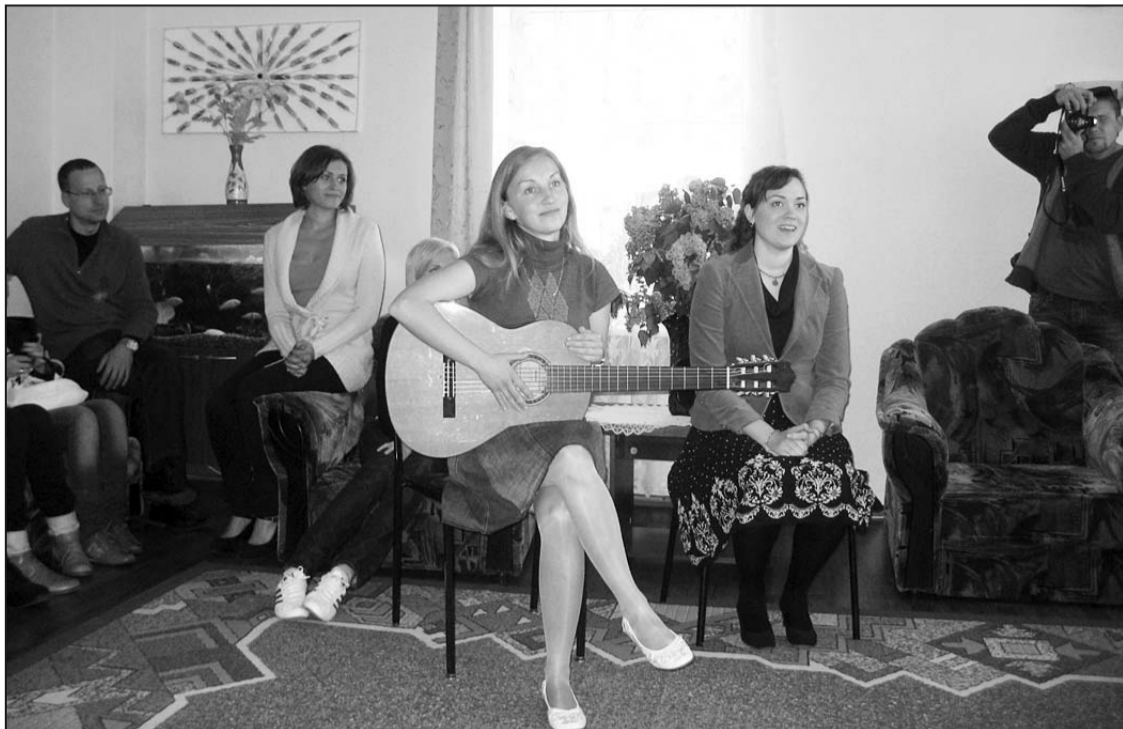
Biedrības "Raduga" dalībnieces sirmgalvjiem dāvāja nelielu koncertu, izpildot latviešu tautasdziesmas.

Aizvadītais mēnesis sociālās aprūpes centrā "Rušona" bija bagāts ar ciemiņiem, kuri ir pārsteiguši un iepriecinājuši mūsu iemītniekus. 19. maijā tālu ceļu no Rīgas mēroja biedrība "Raduga" ar projektu "Neviens nav aizmirsts". Projekts ir vērst uz palīdzību cilvēkiem, kas dzīvo veco ļaužu pansionātos un jūtas vientuļi. Tā ir iespēja atrast vēstuldraugus, kuriem uzticēt savas domas un vienkārši sazināties.