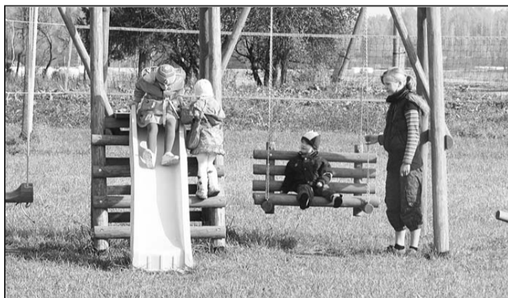
Rotaļu laukumu iemēģina Gribolvas ciema jaunākā paaudze.

Atklāšanas brīdī projekta realizētājus un citus pasākuma viesus sveica Riebiņu novada domes