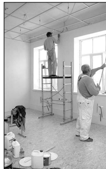
Sabiedriskā centra telpās drīz noslēgsies remontdarbi un tiks izvietots projekta ietvaros iegādātais biroja aprīkojums.