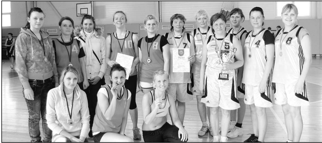
Riebiņu un Stabulnieku sieviešu komandu kopbilde.

Kā ik pavasari Riebiņu novada dome organizēja novada basketbola čempionātu vīriešu un sieviešu komandām. Šogad komandu kopējais skaits gan bija sarucis, taču cīņas spars laukumā bija nemainīgs — cīņa par katru punktu un uzvaru kopumā.